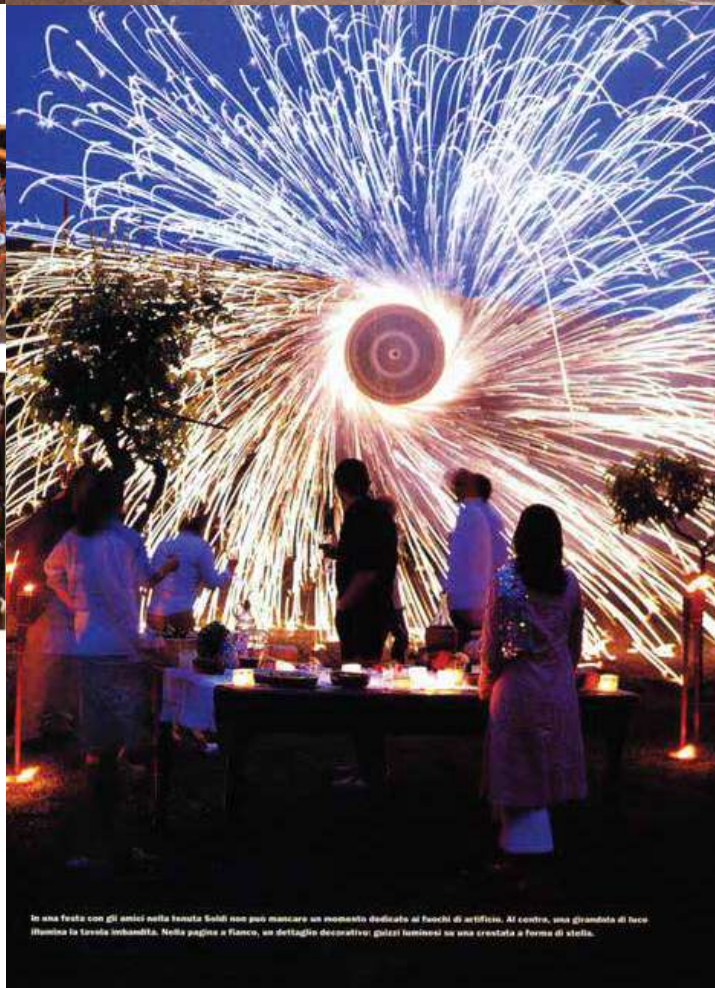
In una festa con gli amici nella tenuta Soldi non puoi mancare un momento dedicato ai fuochi di artificio. Al centro, una giardinata di luce illumina la tavola imbandita. Nella pagina a fianco, un dettaglio decorativo: galzai luminosi su una crestatia a forma di stella.